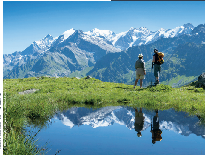
Région Auvergne-Rhône-Alpes - www.rta.fr © Chantal Maréchal/Auvergne-Rhône-Alpes Tourisme